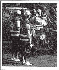
2. ចូលរួមចំណែកក្នុង ការងាររបស់សង្គម ។