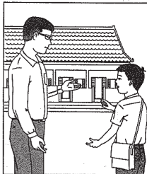
3. និយាយប្រាប់ឪពុកម្តាយ ឬគ្រូពីបញ្ហាទាំងនេះ ។

អ្នកអាចចូលរួមក្នុងសកម្មភាពរបស់សាលារៀន ឬសហគមន៍ជំនុំឱ្យការប្រើប្រាស់គ្រឿង ញៀន ធីកស្រា ឬជក់បារី ។